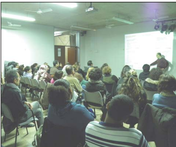
Xerrada del dia 7 de febrer.

Pares i mares, alumnes i algun professor, van assistir a la xerrada “Què fer després de l'ESO?”