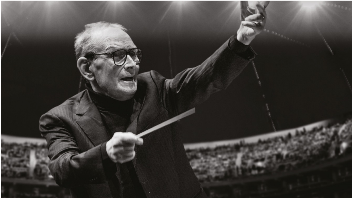
Imatge 2: Ennio Morricone dirigint un des seus concerts.