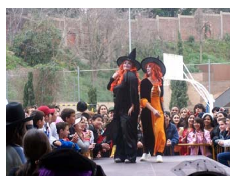
Els alumnes de l'Institut celebren el Carnestoltes