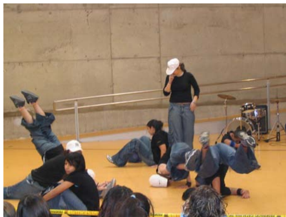
■ Curs de hip hop (Dijous de 5 a 6)