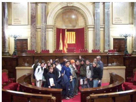
4t d'ESO visita el Parlament de Catalunya