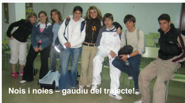
Nois i noies – gaudiu del trajecte!