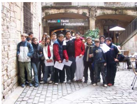
2n d'ESO visita el Museu Tèxtil i d'Indumentària