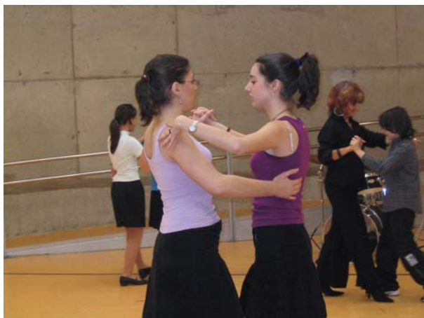
■ Curs de ball de saló (Dimarts de 5 a 6)